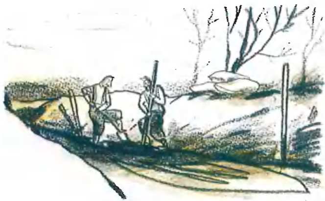
SAMEDI 8 AOÛT Dès 5 heures, nous voilà partis continuer les tranchées. On commence à entendre le canon dans le lointain.

Pour les plus grands, le roman « Le jour où on a retrouvé le soldat Botillon » est construit en double narration, l'une est conduite par le soldat Botillon, l'autre par son arrière-petit-